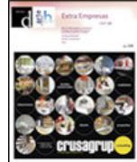
dulcypas extra empresas