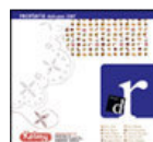
dulcypas R, gran recetario anual