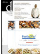
dulcypas mes a mes