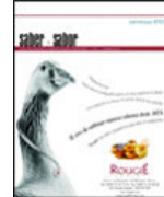
saber y sabor extra empresas