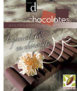
dulcypas especial chocolates