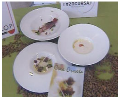
Platos con chufa